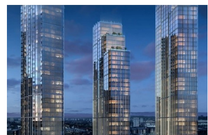
Nine Elms Square, London