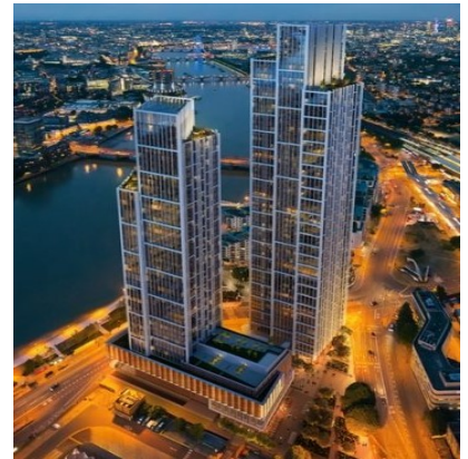
One Nine Elms, London