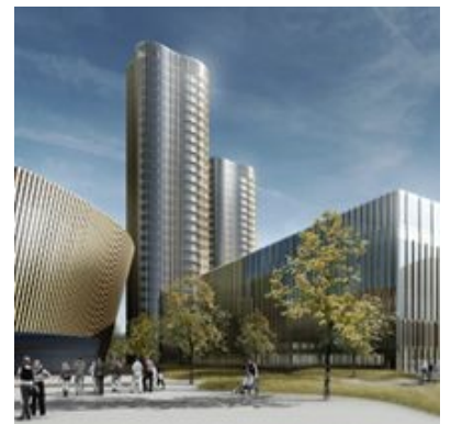
Sportarena Allmend, Luzern